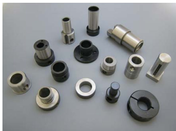
■ブッシュ・カラー類