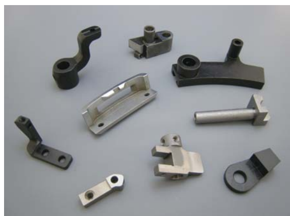
■ロストワックス、鍛造品の加工品